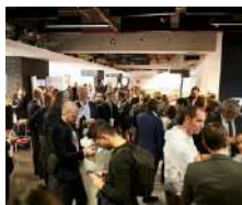
Les Entrepreneurs LPE 06