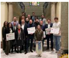
Trophée Rotary de la Création d'Entreprise Rotary Nice