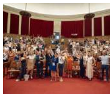
Le Grand Prix Envi des Indépendants