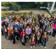
Pitch Party Les Premières Sud

Chaque année, nous participons activement aux actions menées en faveur des chefs d'entreprise.