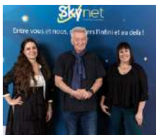
Transmission - Passation SkyNet Expertise et Conseil