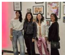
Festival Tribute to Riviera