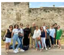
Les Universités Régionales Initiative Sud