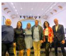
Conférence IA WABG Avocats & Associés