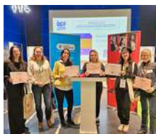
Forum OSE CCI Nice Côte d'Azur