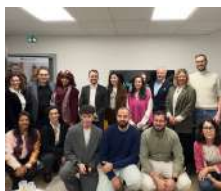
50 Nice Boost La force des réseaux