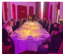
Matinale du dirigeant