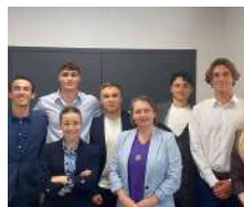
IA & Innovation Durable Edhec