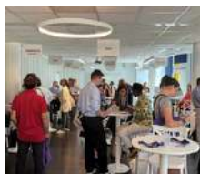
La rentrée des entrepreneurs Métropole Nice Côte d'Azur