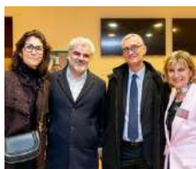
Nuit de la prospective économique Le Portail de la Prévention des Entreprises